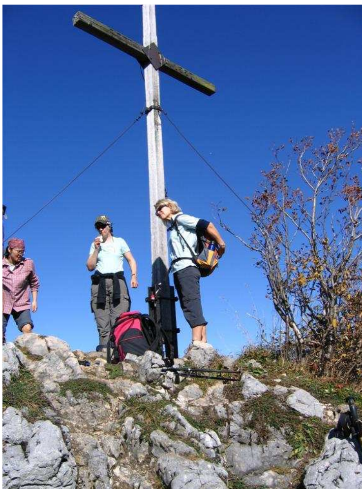
Auf dem Gipfel des Weitlahnerkopf (1615 m)