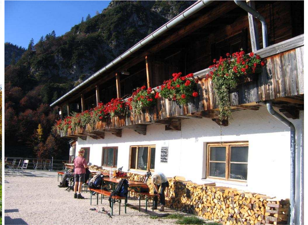
An der Wuhrsteinalm kehrten wir auf eine kurze Trinkpause ein und besuchten das neue Pächterpaar, das wir schon von unserer Frühjahrstour auf den Breitenstein kannten.