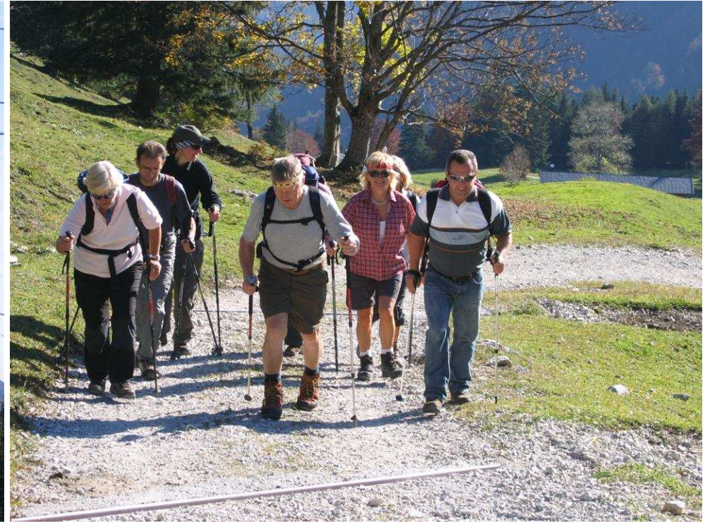
Bei wunderbarem Wetter ging es durch herbstlich gefärbten Wald aufwärts.