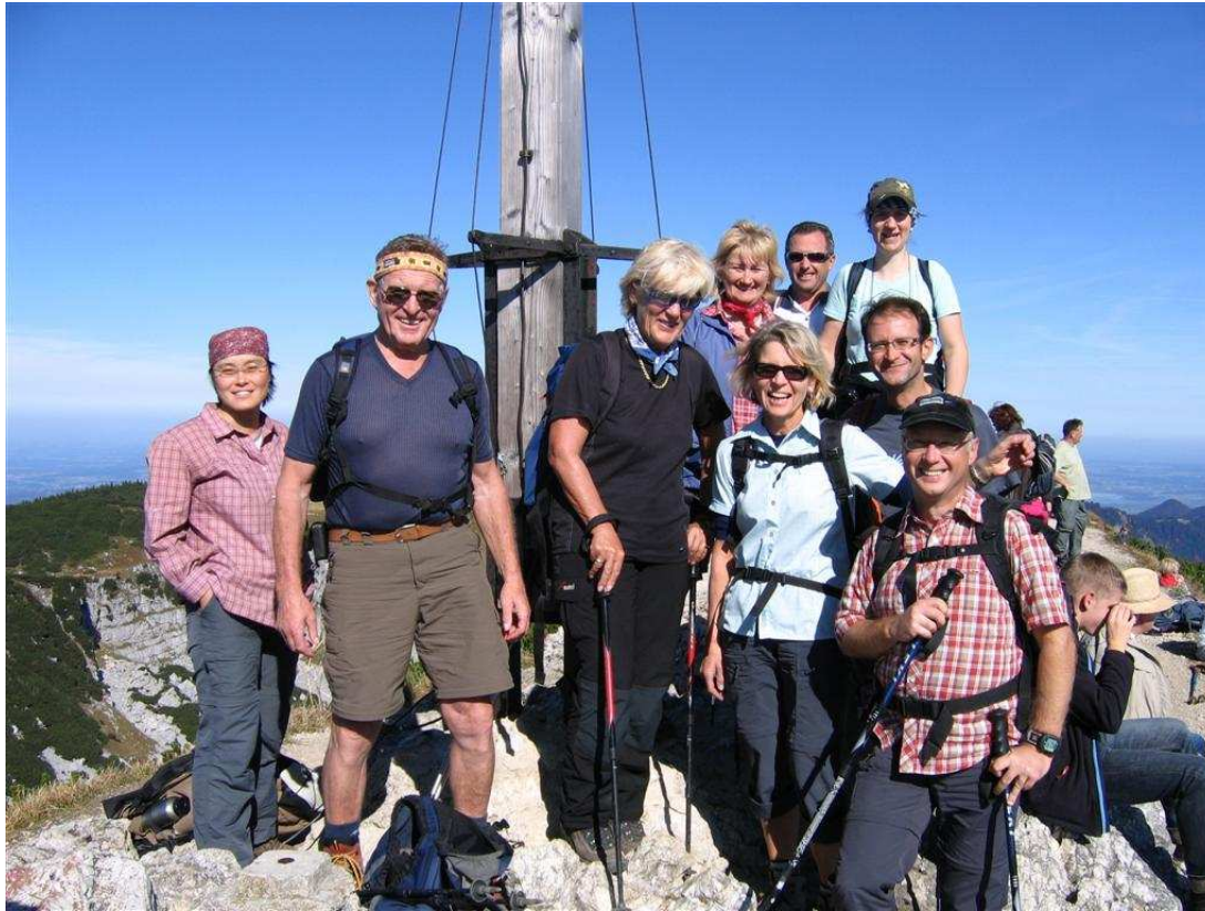
Auf dem Geigelstein Gipfel (1808 m)