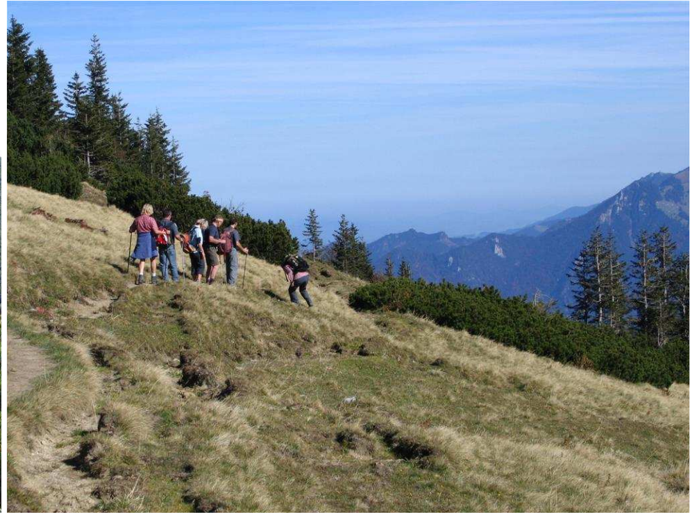
Abstieg vom Geigelstein